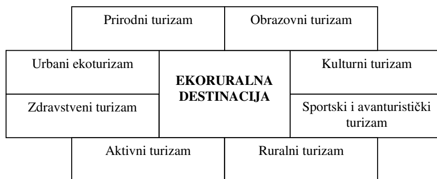
Slika 2: Tržišni segmenti ekoturizma Vojvodine

Ekoturistički proizvod Vojvodine treba da predstavlja suštinski zaokruženu celinu primarnih elemenata (prirodni, kulturno-istorijski, etnografski...) i sekundarnih delova turističke ponude namenjenih određenoj kategoriji turista odgovornih prema zaštiti prirode, obrazovnoj interakciji i poštovanju lokalnih kulturnih i drugih autentičnosti. Ekoturistički proizvod mogu oblikovati: